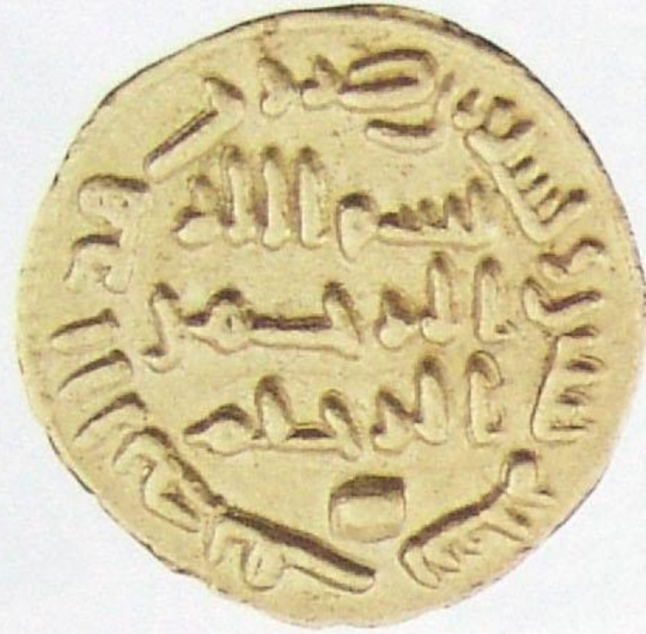
نصف دينار الوليد بن عبد الملك سنة: ٩٢ هجري